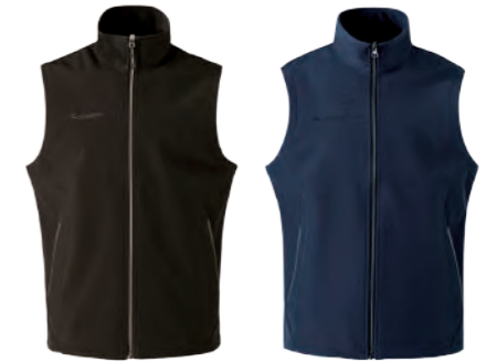
J717A 黑色 | J717B 藍綠 防水透氣薄背心 $2380 (未稅) 96% POLYESTER 4% 彈性纖維 ▶ 形象頁請見 P59