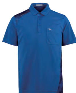
2511A 寶藍 $2080 (未稅) 85% POLYESTER 15% 彈性纖維 抗紫外線 吸濕排汗布