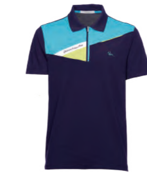
2110A 藍紫 / 彩藍 $1980 (未稅) 52% COTTON 43% POLYESTER 5% 彈性纖維 抗 UV 棉質網眼布