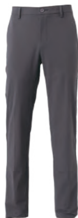
1018C 深灰 彈力休閒長褲 $3580 (未稅) 90% NYLON 10% 彈性纖維 ▶ 形象頁請見 P61