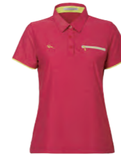
2310B 女版 紅 $2380 (未稅) 57% NYLON 28% POLYESTER 15% 彈性纖維 涼感 抗紫外線