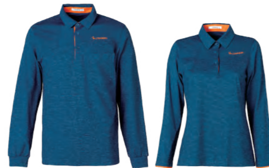
2663A | 2663B 女版 藍綠 $2380 (未稅) 100% POLYESTER 抗紫外線 吸濕排汗布