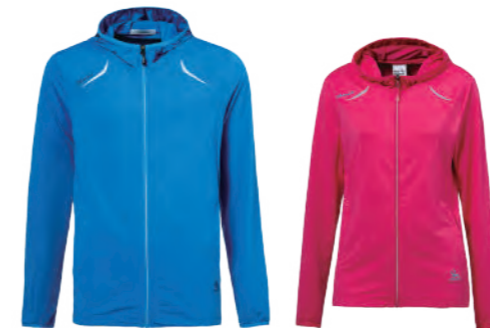
9517A 彩藍 | 9517B 女版 桃紅 涼感排汗針織外套 $3280 (未稅) 85% POLYESTER 15% 彈性纖維 抗紫外線 吸濕排汗布 涼感