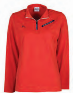
2162B 女版 橘色 $2380 (未稅) 58% COTTON 37% POLYESTER 5% 彈性纖維 抗紫外線 棉質彈力布