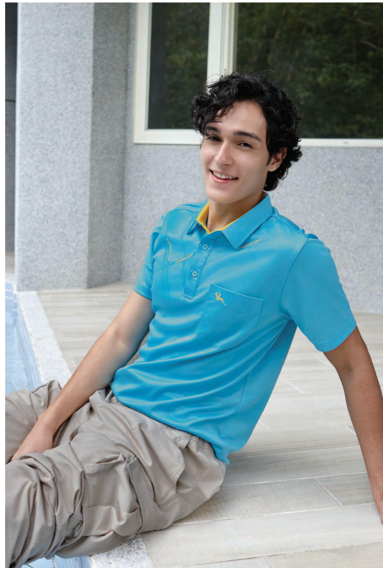
2910A 水色 $1980 (未稅) - 100% POLYESTER 抗紫外線 吸濕排汗布