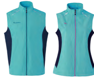
J716A | J716B 女版 水色 / 深藍 彈性背心 $2380 (未稅) 93% POLYESTER 7% 彈性纖維 ▶ 形象頁請見 P60