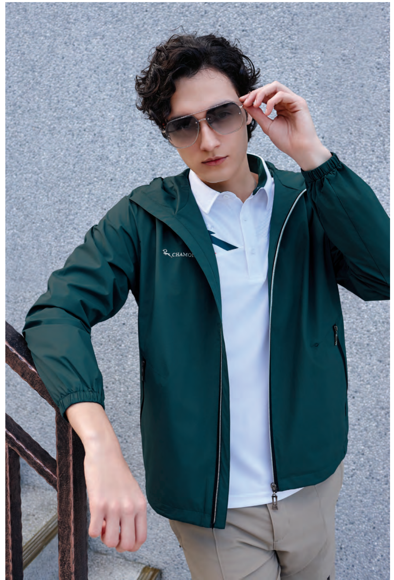
7591 松綠色 防水透氣輕薄風衣 $2880 (未稅) - 100% POLYESTER 抗紫外線 附收納袋