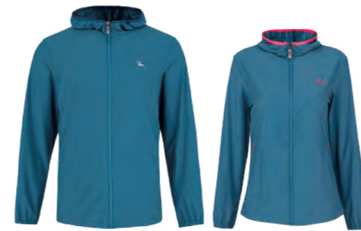
9521A | 9521B 女版 雲山藍 冰涼針織外套 $3280 (未稅) 75% NYLON 25% 彈性纖維 抗紫外線 涼感 ▶ 形象頁請見 P55