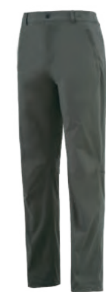
6611 軍綠色 彈力登山褲 $3580 (未稅) 100% POLYESTER 吸濕排汗布