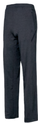
5531A 黑麻灰 針織長褲 $1780 (未稅) 92% POLYESTER 8% 彈性纖維 吸濕排汗布