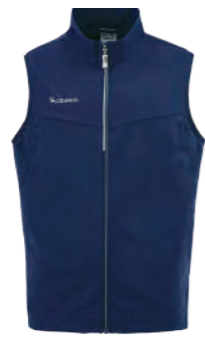
J719 藍紫色 針織背心 $2180 (未稅) 83% NYLON 17% 彈性纖維 涼感 抗紫外線 ▶ 形象頁請見 P62