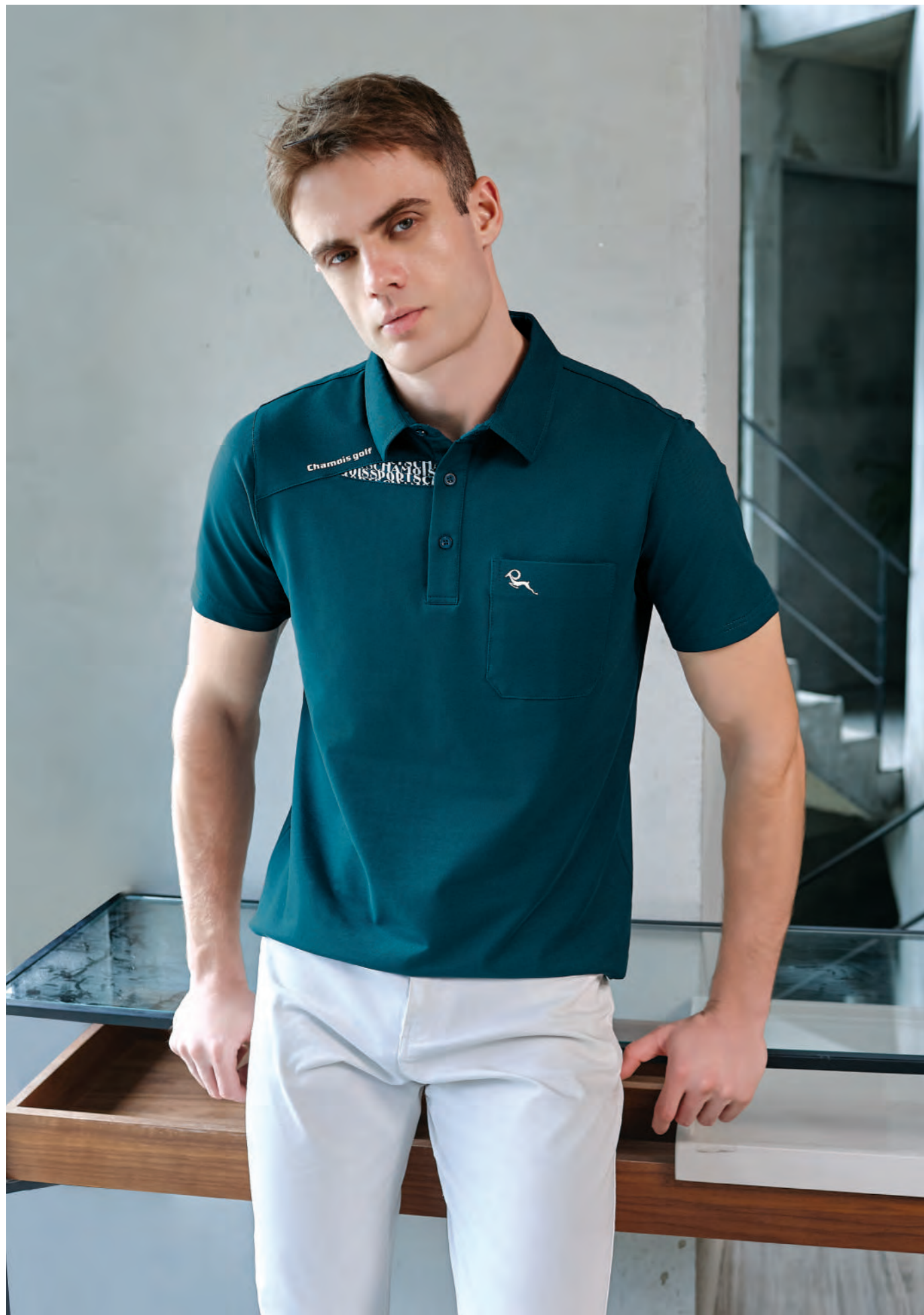
35 2801A 墨綠 $1980 (未稅) - 52% COTTON 43% POLYESTER 5% 彈性纖維 抗UV 棉質網眼布