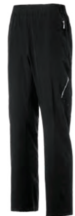
955 黑 彈力運動長褲 $1880 (未稅) 93% POLYESTER 7% 彈性纖維