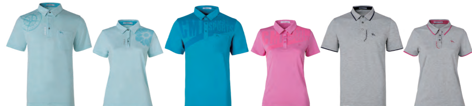
2702A | 2702B 女版 水色 $2080 (未稅) 92% POLYESTER 8% 彈性纖維 抗紫外線 吸濕排汗布 ▶ 形象頁請見 P39