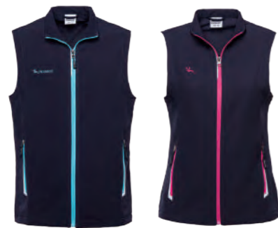
J713A | J713B 女版 深藍 彈性背心 $2380 (未稅) 93% POLYESTER 7% 彈性纖維 ▶ 形象頁請見 P63