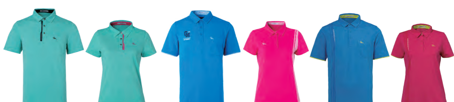
2706A | 2706B 女版 水綠 $1980 (未稅) 52% COTTON 43% POLYESTER 5% 彈性纖維 抗 UV 棉質網眼布 ▶ 形象頁請見 P41