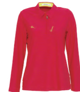
2265B 女版 紅 $2380 (未稅) 57% NYLON 28% POLYESTER 15% 彈性纖維 抗紫外線