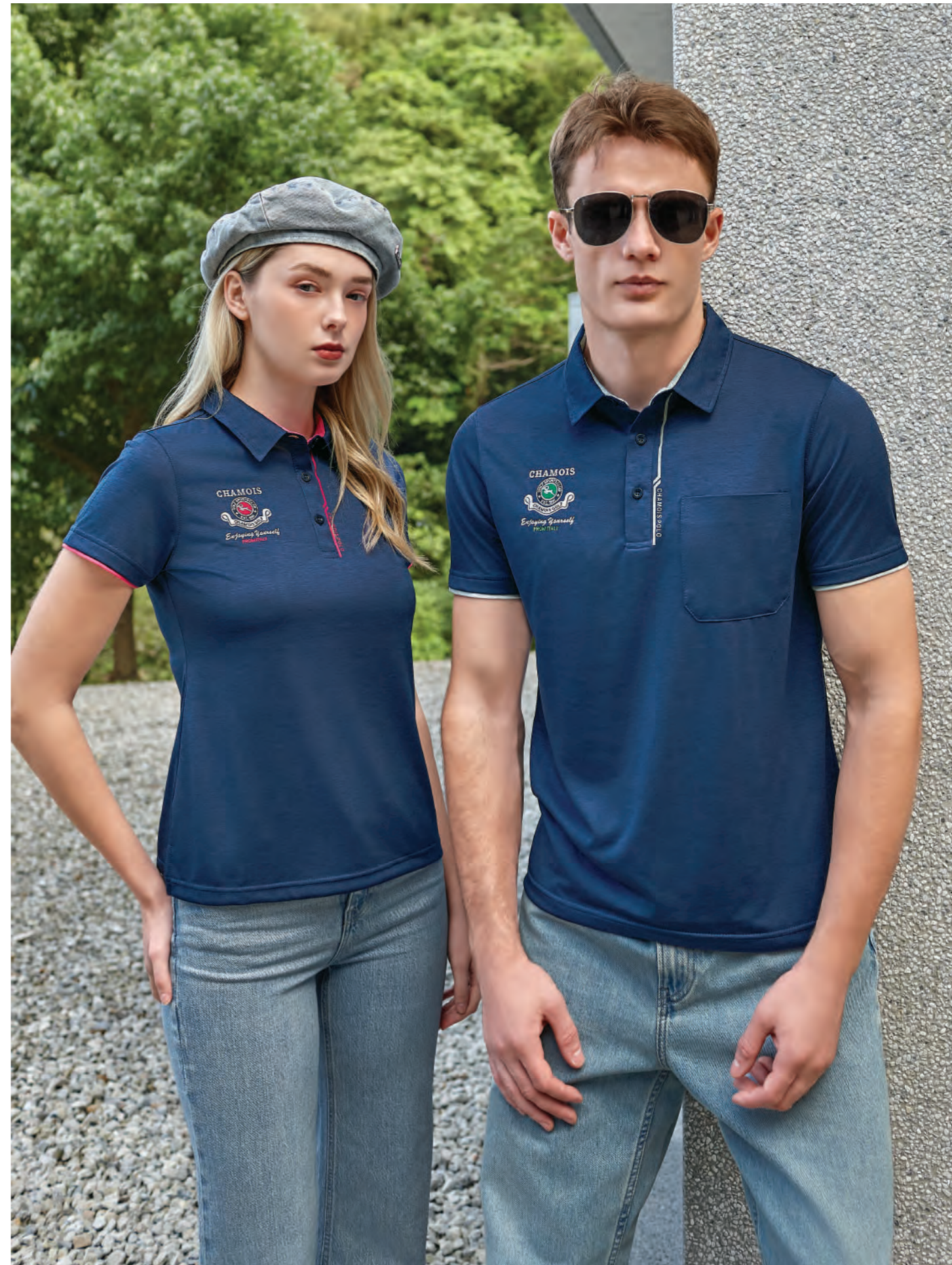
(左) 2905B 女版 | (右) 2905A 深藍 $2080 (未稅) - 100% POLYESTER 抗紫外線 吸濕排汗布