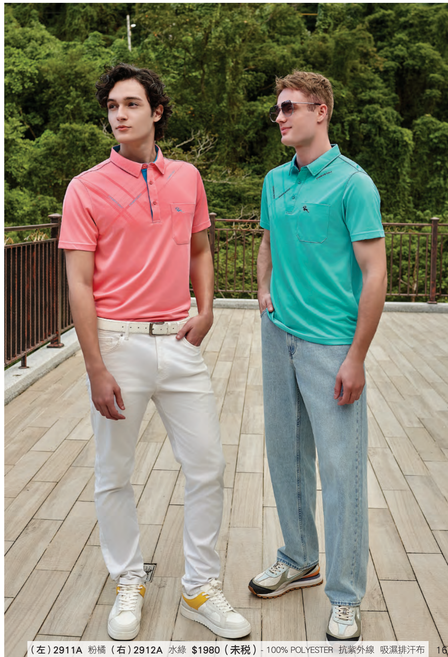
(左) 2911A 粉橘 (右) 2912A 水綠 $1980 (未税) - 100% POLYESTER 抗紫外線 吸濕排汗布