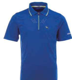
2216A 彩藍 $1980 (未稅) 100% POLYESTER 抗紫外線 吸濕排汗布