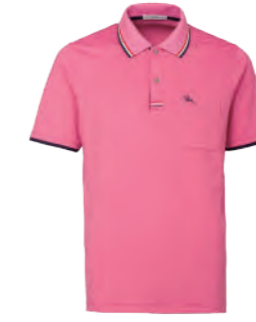
2301A 粉紅 $1680 (未稅) 100% POLYESTER 抗紫外線 吸濕排汗布