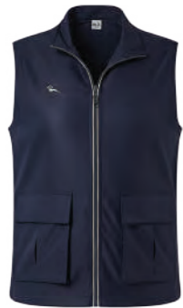
J723 深藍 多口袋背心 $2180 (未稅) 48% POLYESTER 39% COTTON 13% 萊賽爾 ▶ 形象頁請見 P58