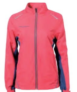
7581B 女版 西瓜紅 防水透氣網裡外套 $2880 (未稅) 100% POLYESTER 抗紫外線