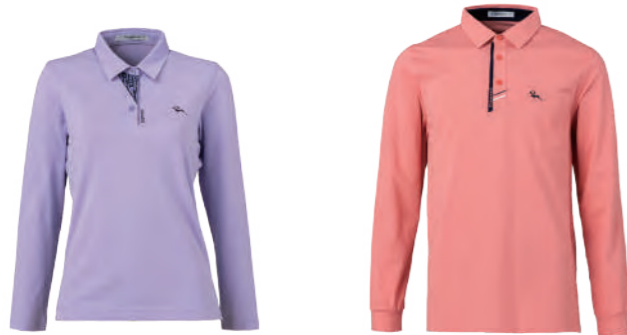
2765B 女版 粉紫 $2380 (未稅) 52% COTTON 43% POLYESTER 5% 彈性纖維 抗 UV 棉質網眼布