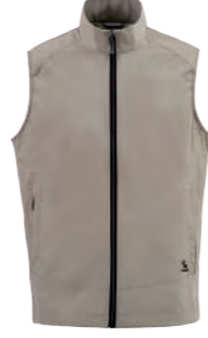
J720 綠卡其 單層薄背心 $2080 (未稅) 100% POLYESTER ▶ 形象頁請見 P57