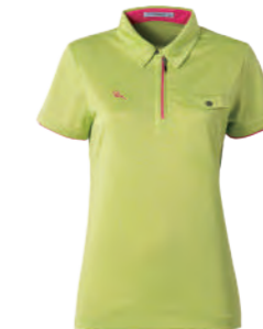
2303B 女版 果綠 $1980 (未稅) 100% POLYESTER 抗紫外線 吸濕排汗布