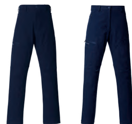
6613A | 6613B 女版 深藍 厚裡貼合彈力登山褲 $3780 (未稅) 76% POLYESTER 24% 彈性纖維