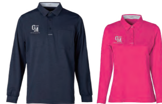
2661A 深藍 | 2661B 女版 桃紅 $2380 (未稅) 100% POLYESTER 抗紫外線 吸濕排汗布