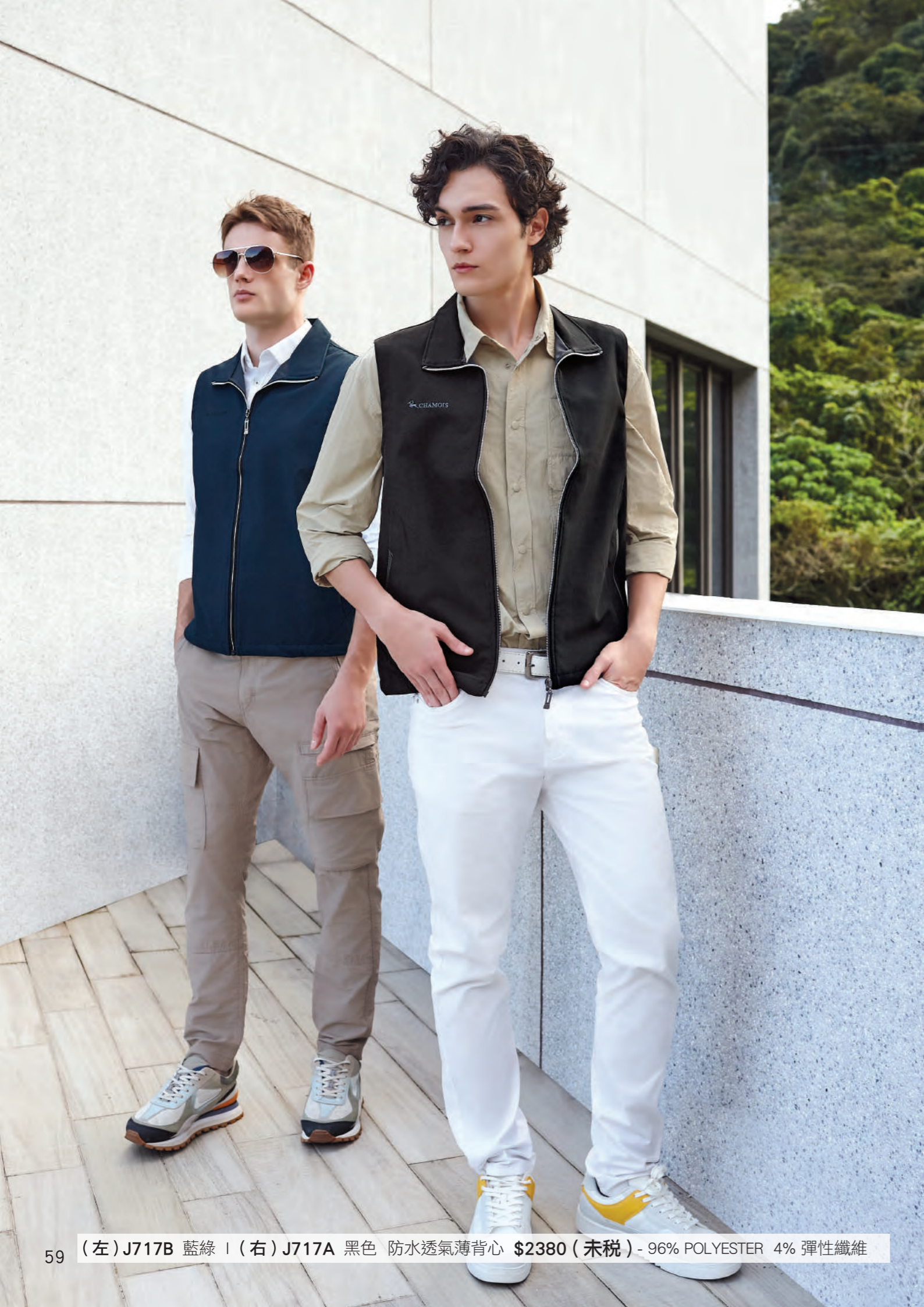
59 (左) J717B 藍綠 | (右) J717A 黑色 防水透氣薄背心 $2380 (未稅) - 96% POLYESTER 4% 彈性纖維