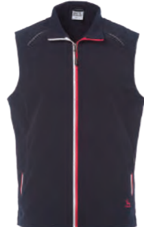
J711 深藍 彈性背心 $2080 (未稅) 93% POLYESTER 7% 彈性纖維 ▶ 形象頁請見 P61