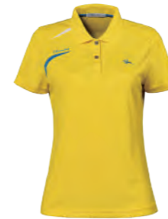
2503B 女版 黃色 $1680 (未稅) 100% POLYESTER 抗紫外線 吸濕排汗布