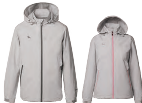
7593A | 7593B 女版 淺灰色 防水透氣網裡外套 $3080 (未稅) 100% POLYESTER 抗紫外線 ▶ 形象頁請見 P47