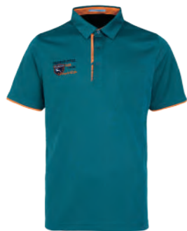
2812A 墨綠 $2080 (未稅) 100% POLYESTER 奈米竹炭 抗紫外線 吸濕排汗布 ▶ 形象頁請見 P25