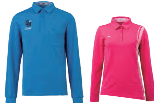
2762A 彩藍 | 2762B 女版 桃紅 $2380 (未稅) 52% COTTON 43% POLYESTER 5% 彈性纖維 抗 UV 棉質網眼布