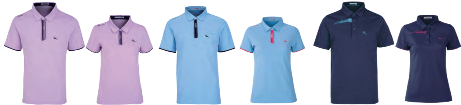
2802A | 2802B 女版 粉紫 $1980 (未稅) 52% COTTON 43% POLYESTER 5% 彈性纖維 抗 UV 棉質網眼布 ▶ 形象頁請見 P36