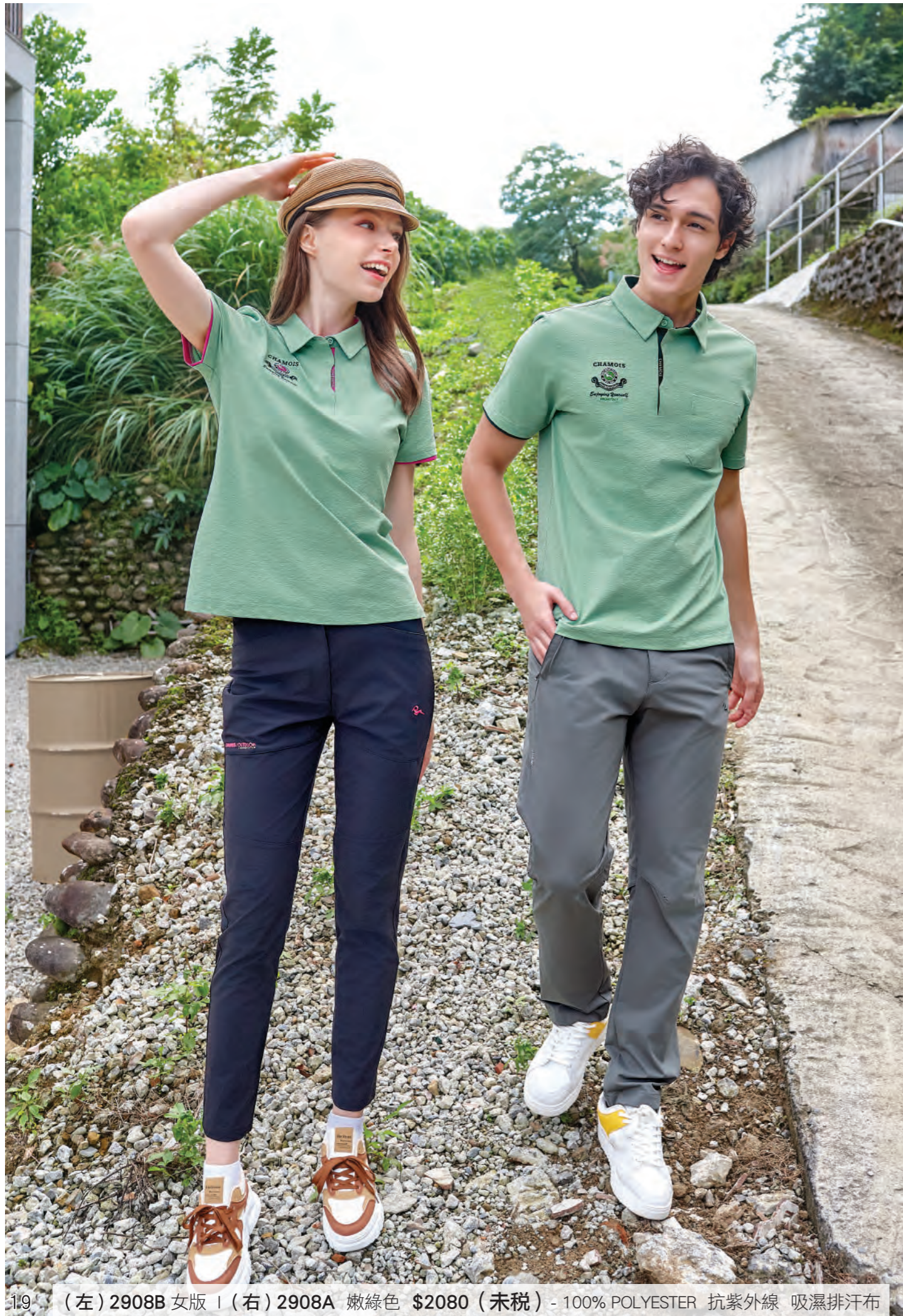
19 (左) 2908B 女版 | (右) 2908A 嫩綠色 $2080 (未稅) - 100% POLYESTER 抗紫外線 吸濕排汗布