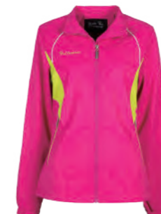
7583B 女版 桃紅 / 果綠 防水透氣網裡外套 $2880 (未稅) 100% POLYESTER 抗紫外線