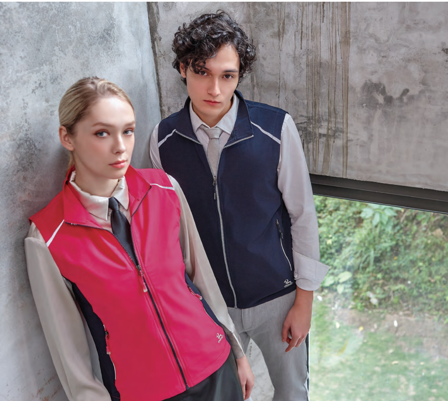
(左) J710B 女版 桃紅 | (右) J710A 深藍 彈性背心 $2080 (未稅) - 93% POLYESTER 7% 彈性纖維