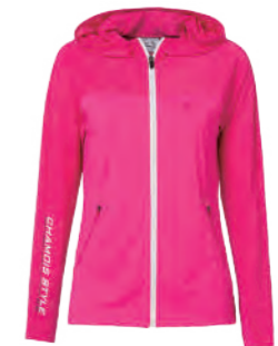
9512 女版 桃紅 針織外套 $3080 (未稅) 88% POLYESTER 12% 彈性纖維 抗紫外線 吸濕排汗布