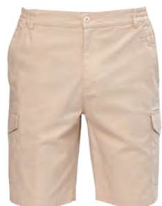
113A 卡其 彈力休閒短褲 $2180 (未稅) 96% NYLON 4% 彈性纖維