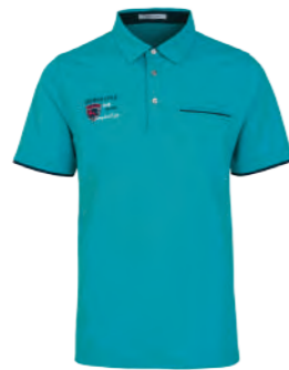
2803A 孔綠 $1980 (未稅) 52% COTTON 43% POLYESTER 5% 彈性纖維 抗 UV 棉質網眼布 ▶ 形象頁請見 P29