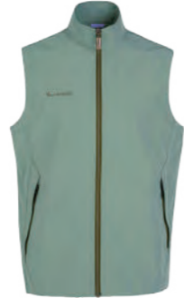
J718 薄荷綠 彈性背心 $2080 (未稅) 93% POLYESTER 7% 彈性纖維 ▶ 形象頁請見 P62