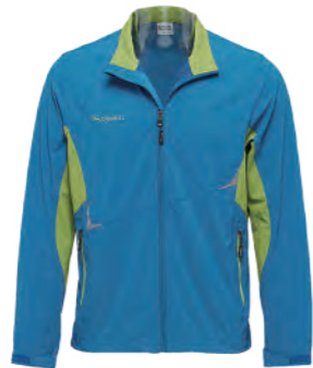
9713A 湖藍 吸濕速乾彈性外套 $4280 (未稅) 88% NYLON 12% 彈性纖維