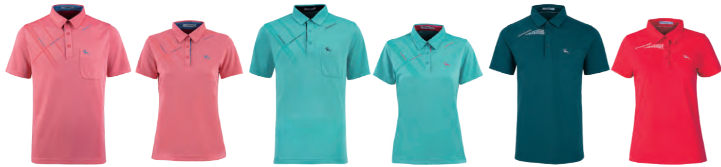
2911A | 2911B 女版 粉橘 $1980 (未稅) 100% POLYESTER 抗紫外線 吸濕排汗布 ▶ 形象頁請見 P16 / P17