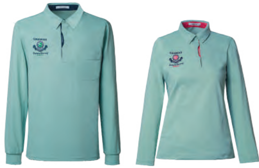
2961A | 2961B 女版 嫩綠 $2380 (未稅) 100% POLYESTER 抗紫外線 / 吸濕排汗