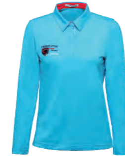
2561B 女版 水藍 $2380 (未稅) 52% COTTON 43% POLYESTER 5% 彈性纖維 抗 UV 棉質網眼布