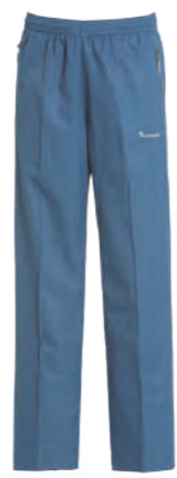
935 海藍 全裡風衣長褲 $1780 (未稅) 100% POLYESTER