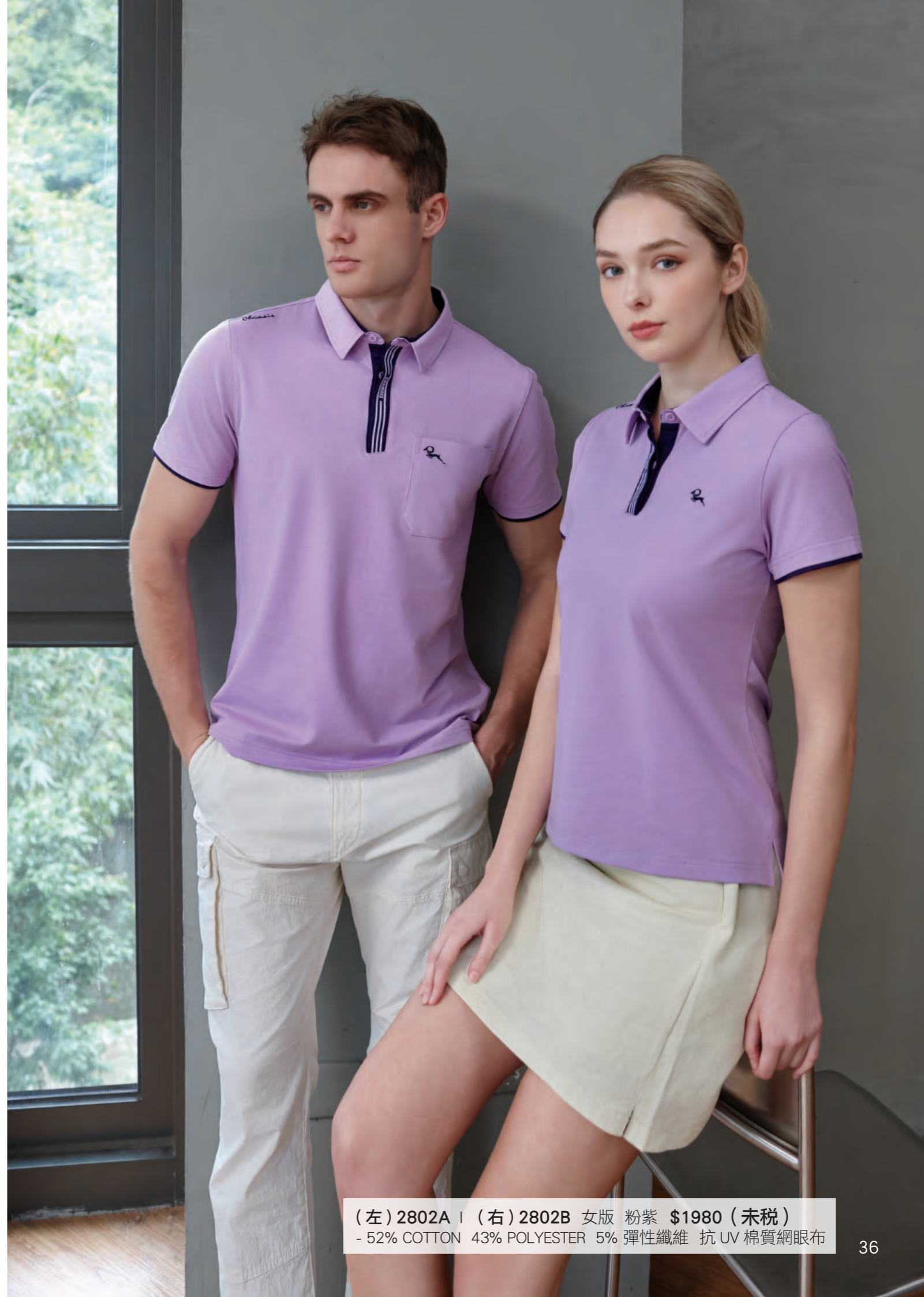
(左) 2802A | (右) 2802B 女版 粉紫 $1980 (未稅) - 52% COTTON 43% POLYESTER 5% 彈性纖維 抗UV 棉質網眼布