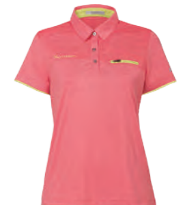
2309B 女版 橘色 $2080 (未稅) 90% POLYESTER 10% 彈性纖維 抗紫外線