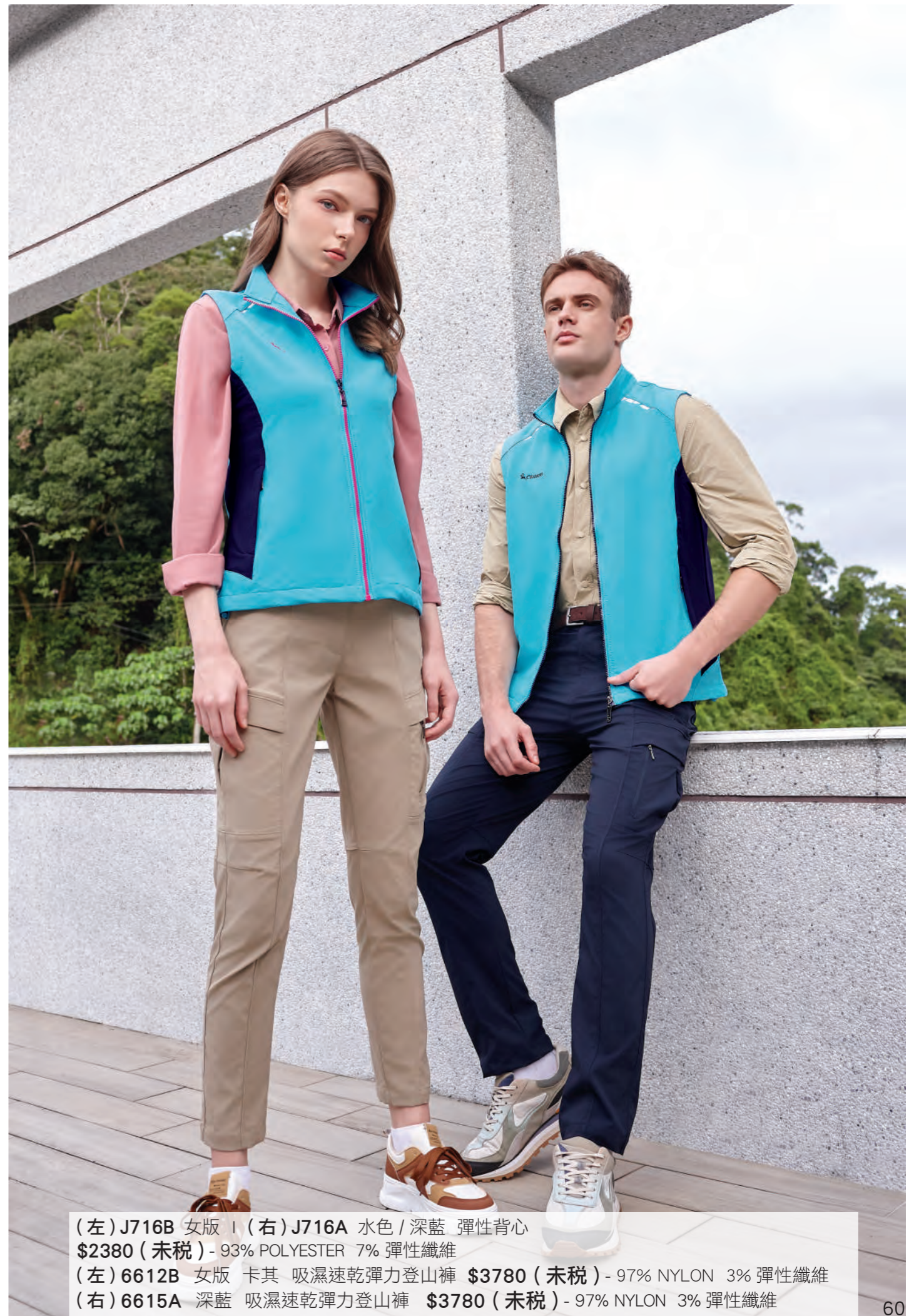
(左) J716B 女版 | (右) J716A 水色 / 深藍 彈性背心 $2380 (未稅) - 93% POLYESTER 7% 彈性纖維 (左) 6612B 女版 卡其 吸濕速乾彈力登山褲 $3780 (未稅) - 97% NYLON 3% 彈性纖維 (右) 6615A 深藍 吸濕速乾彈力登山褲 $3780 (未稅) - 97% NYLON 3% 彈性纖維