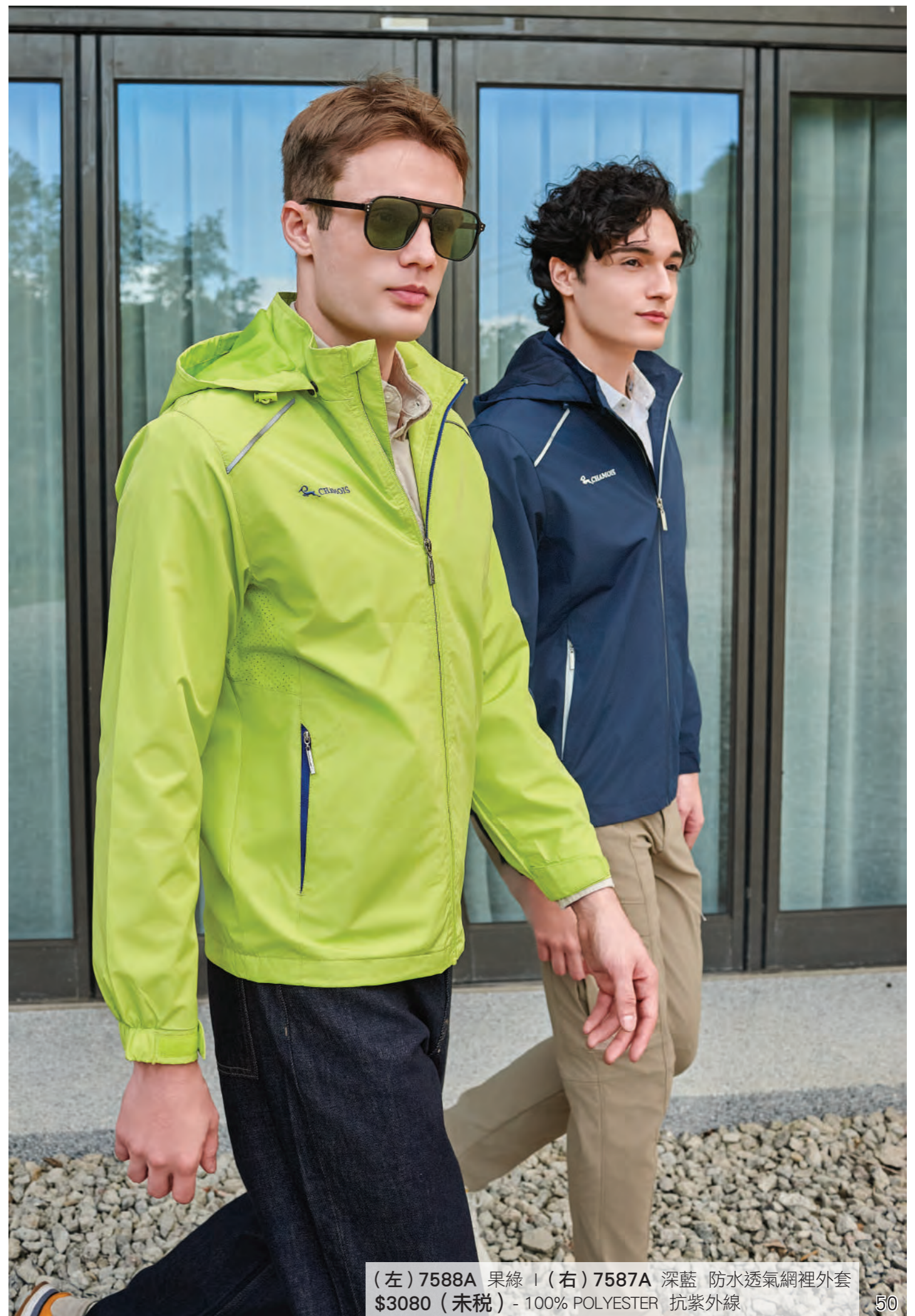
(左) 7588A 果綠 | (右) 7587A 深藍 防水透氣網裡外套 $3080 (未稅) - 100% POLYESTER 抗紫外線