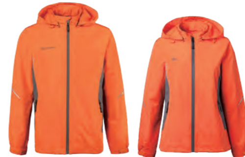
7586A | 7586B 女版 亮橘 防水透氣網裡外套 $3080 (未稅) 100% POLYESTER 抗紫外線 ▶ 形象頁請見 P56