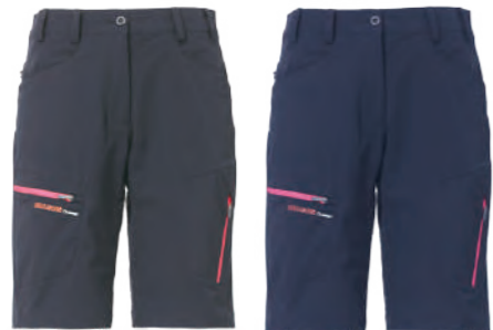
116A 女版 深灰 | 116B 女版 深藍 彈力休閒短褲 $2180 (未稅) 90% NYLON 10% 彈性纖維