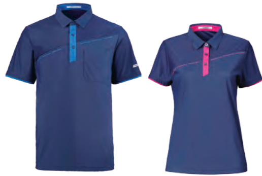
2510A | 2510B 女版 藍紫 $1980 (未稅) 87% NYLON 13% 彈性纖維 抗紫外線 吸濕排汗布 涼感 ▶ 形象頁請見 P46