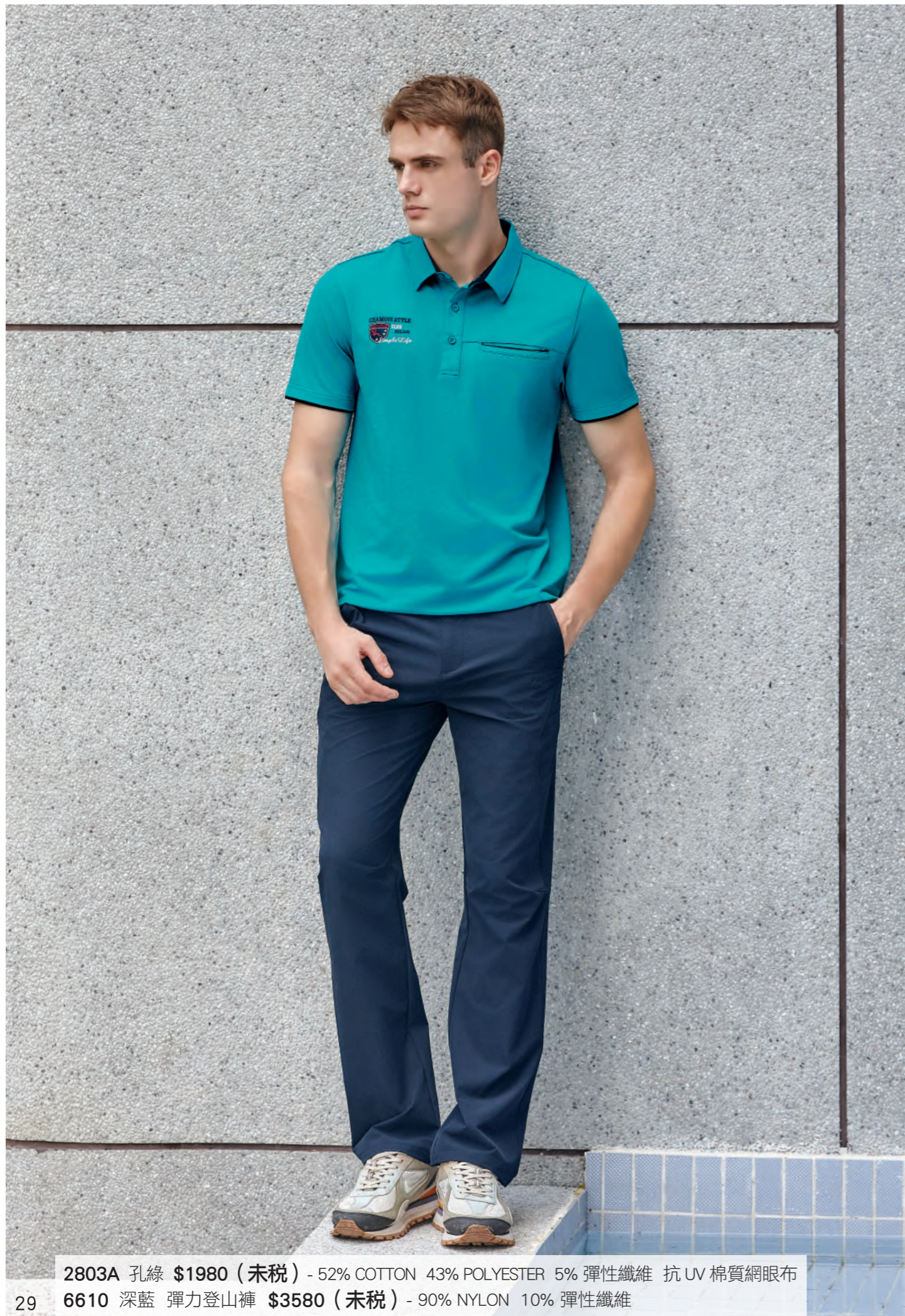
2803A 孔綠 $1980 (未稅) - 52% COTTON 43% POLYESTER 5% 彈性纖維 抗 UV 棉質網眼布 6610 深藍 彈力登山褲 $3580 (未稅) - 90% NYLON 10% 彈性纖維