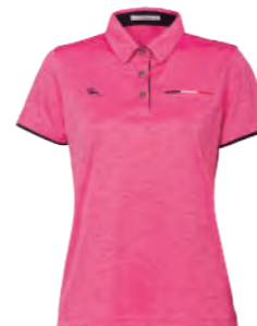
2306B 女版 桃紅 $2080 (未稅) 100% POLYESTER 抗紫外線 吸濕排汗布