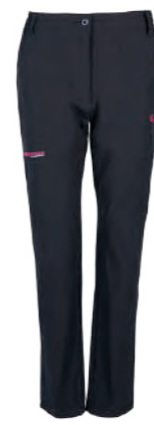
6605 女版 黑 彈力登山褲 $3580 (未稅) 90% NYLON 10% 彈性纖維 ▶ 形象頁請見 P55 / P56