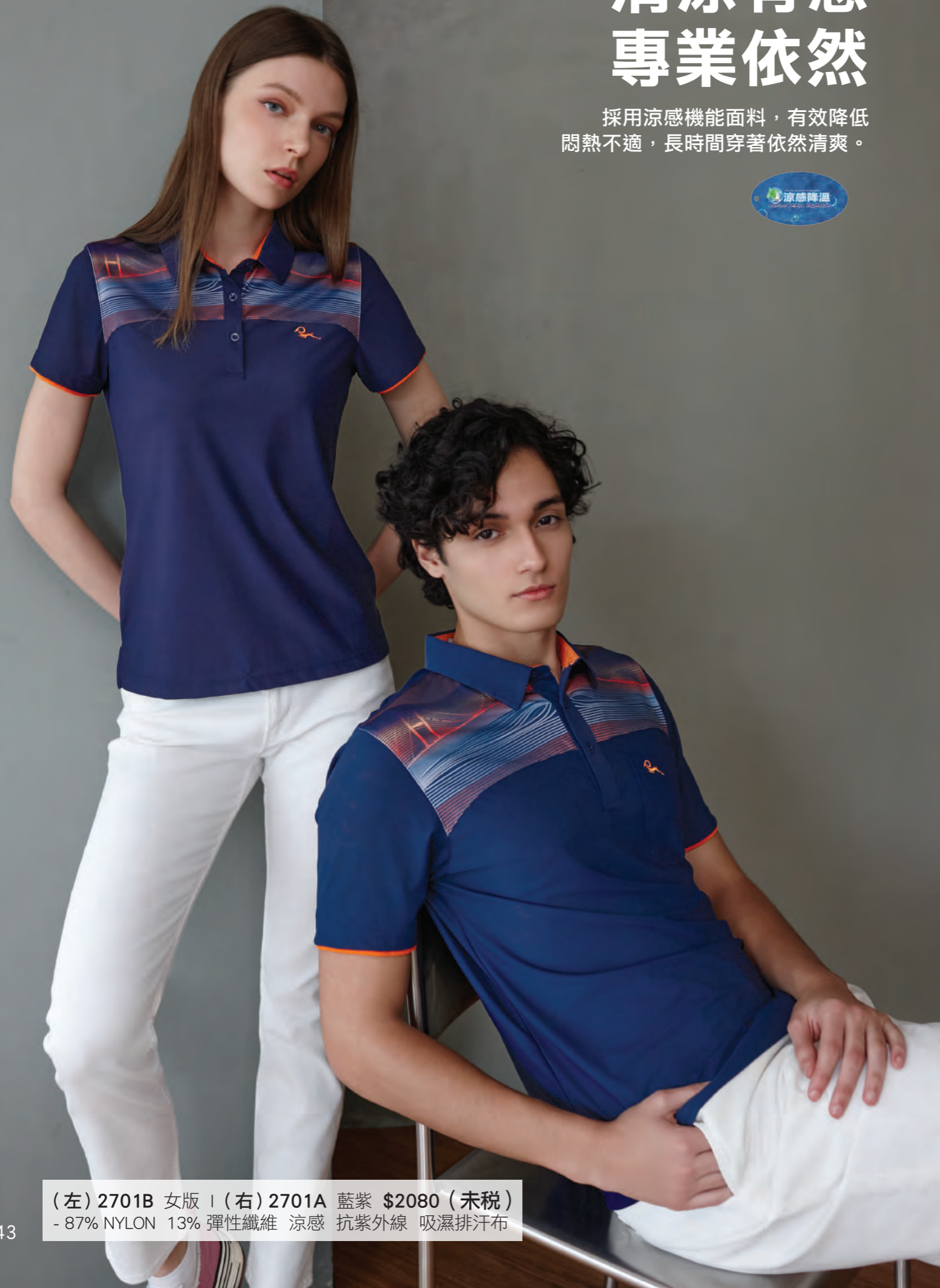
(左) 2701B 女版 | (右) 2701A 藍紫 $2080 (未稅) - 87% NYLON 13% 彈性纖維 涼感 抗紫外線 吸濕排汗布