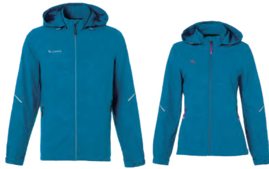
9519A | 9519B 女版 海藍 彈性外套 $3080 (未稅) 93% POLYESTER 7% 彈性纖維 抗紫外線 附收納袋 ▶ 形象頁請見 P48