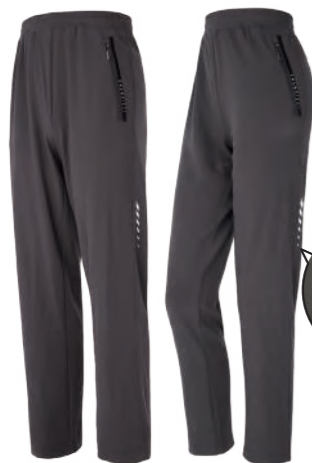
5535A | 5535B 女版 灰色 排汗針織長褲 $1880 (未稅) 100% POLYESTER 吸濕排汗布