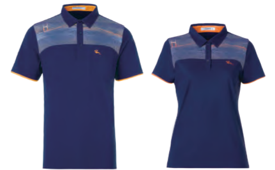
2701A | 2701B 女版 藍紫 $2080 (未稅) 87% NYLON 13% 彈性纖維 涼感 抗紫外線 吸濕排汗布 ▶ 形象頁請見 P43