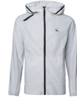
9520A 白色 機能防護抗菌防曬外套 $3280 (未稅) 100% POLYESTER 原紗抗菌 抗紫外線