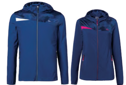
9516A | 9516B 女版 藍紫 冰涼針織外套 $3280 (未稅) 76% NYLON 24% 彈性纖維 抗紫外線 涼感 ▶ 形象頁請見 P52