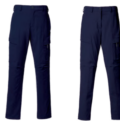
6615A | 6615B 女版 深藍 吸濕速乾彈力登山褲 $3780 (未稅) 97% NYLON 3% 彈性纖維 ▶ 形象頁請見 P60 / P12.67.68