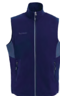
J707C 深藍 防水透氣薄背心 $2380 (未稅) 93% POLYESTER 7% 彈性纖維 ▶ 形象頁請見 P66