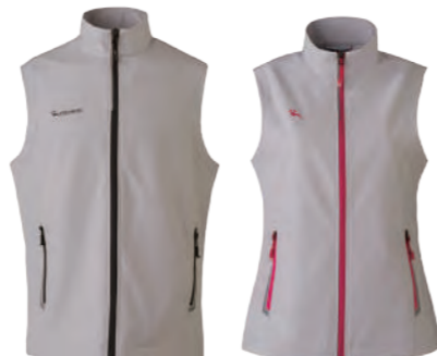
J715A | J715B 女版 米灰色 彈性背心 $2380 (未稅) 93% POLYESTER 7% 彈性纖維 ▶ 形象頁請見 P64