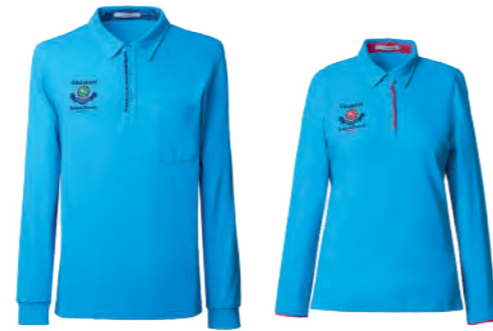
2962A | 2962B 女版 水藍 $2380 (未稅) 52% COTTON 43% POLYESTER 5% 彈性纖維 抗 UV 棉質網眼布