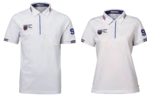
2215A | 2215B 女版 白色 $1980 (未稅) 52% COTTON 43% POLYESTER 5% 彈性纖維 抗 UV 棉質網眼布 ▶ 形象頁請見 P44 / P45