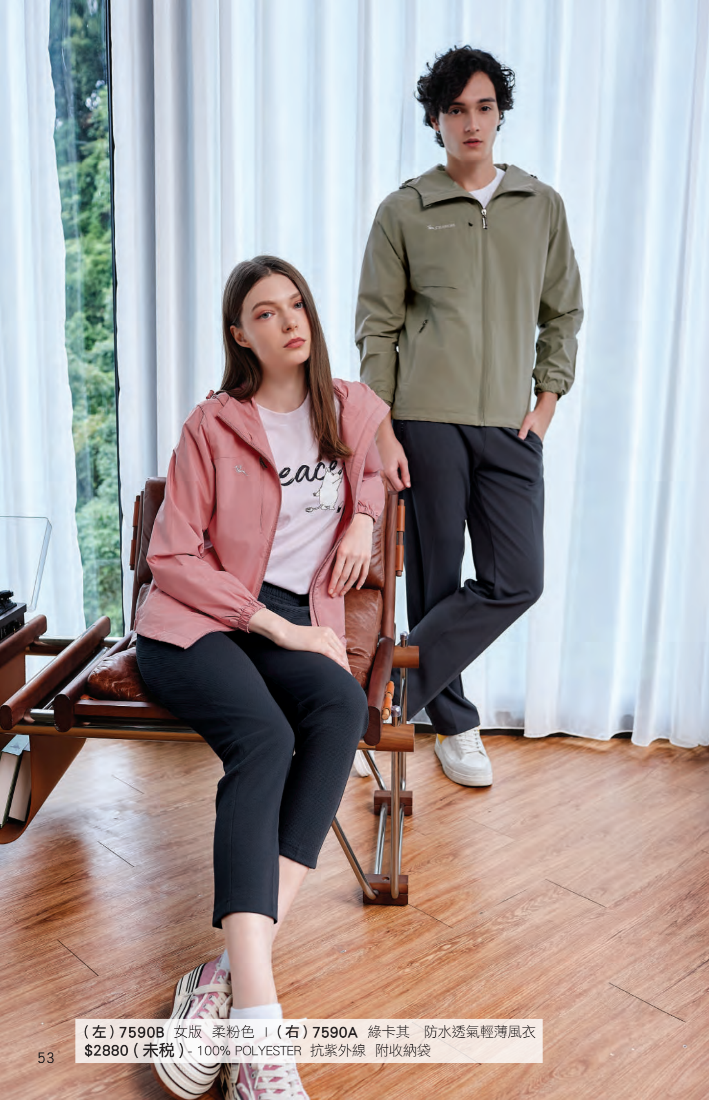
(左) 7590B 女版 柔粉色 | (右) 7590A 綠卡其 防水透氣輕薄風衣 $2880 (未稅) - 100% POLYESTER 抗紫外線 附收納袋