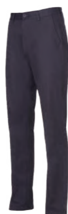
1020B 深藍 純棉彈力休閒長褲 $2880 (未稅) 96% COTTON 4% 彈性纖維 ▶ 形象頁請見 P30