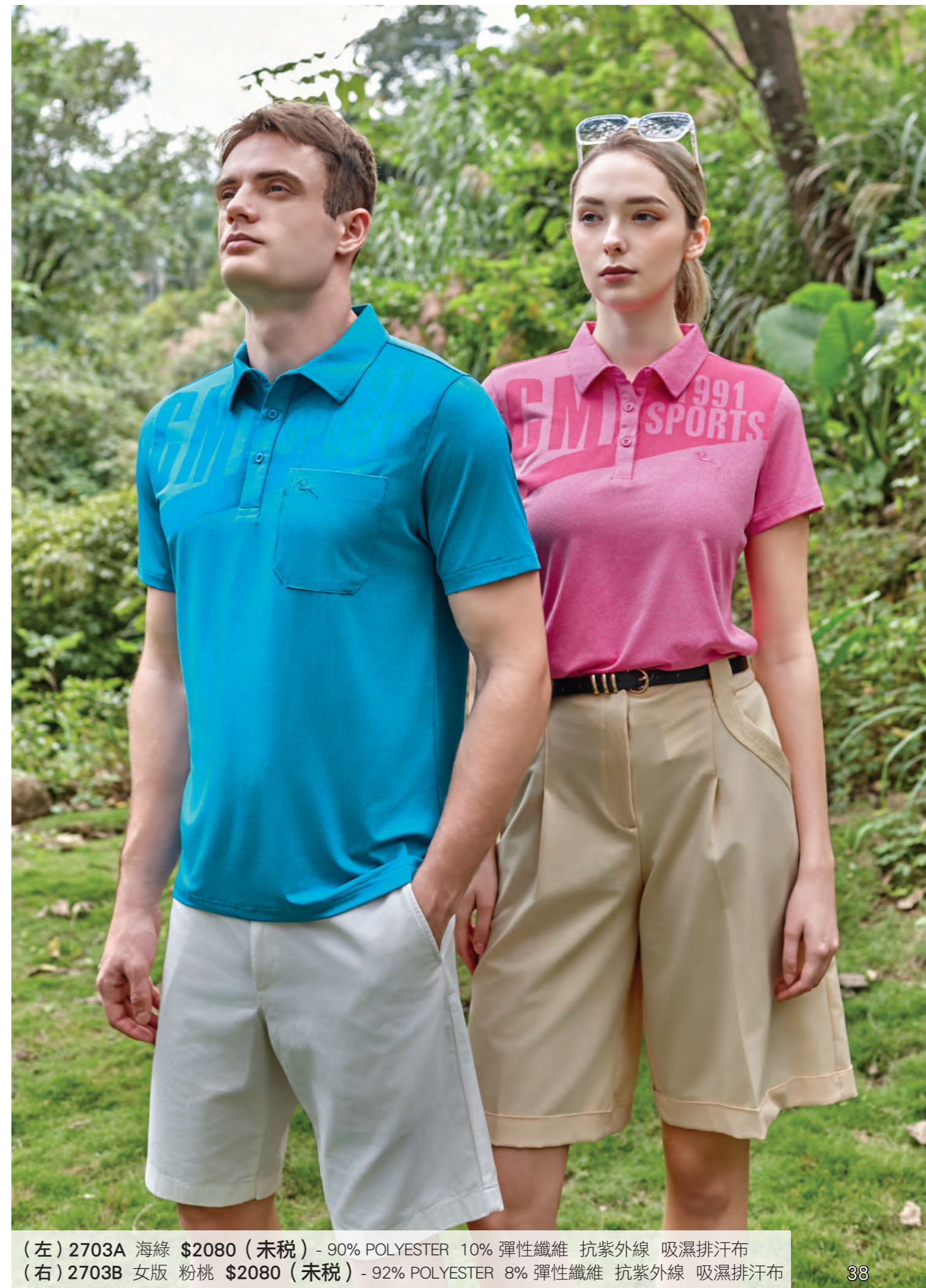
(左) 2703A 海綠 $2080 (未稅) - 90% POLYESTER 10% 彈性纖維 抗紫外線 吸濕排汗布 (右) 2703B 女版 粉桃 $2080 (未稅) - 92% POLYESTER 8% 彈性纖維 抗紫外線 吸濕排汗布