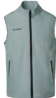
J722 淡綠色 彈性背心 $2080 (未稅) 93% POLYESTER 7% 彈性纖維 ▶ 形象頁請見 P61