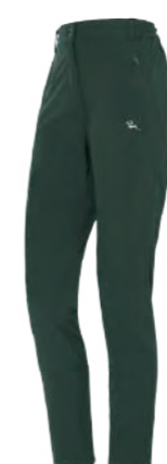
6609 女版 深灰綠 彈力登山褲 $3780 (未稅) 93% POLYESTER 7% 彈性纖維 ▶ 形象頁請見 P30