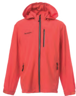
9507 橘色 彈性外套 $3080 (未稅) 93% POLYESTER 7% 彈性纖維 抗紫外線