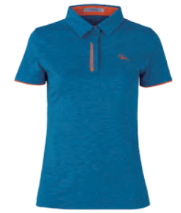
2811B 女版 海藍 $2080 (未稅) 100% POLYESTER 抗紫外線 吸濕排汗布 ▶ 形象頁請見 P14