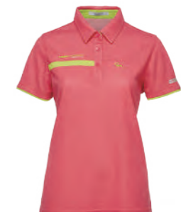
2115B 女版 橘紅 $2380 (未稅) 93% POLYESTER 7% 彈性纖維 抗紫外線 吸濕排汗布