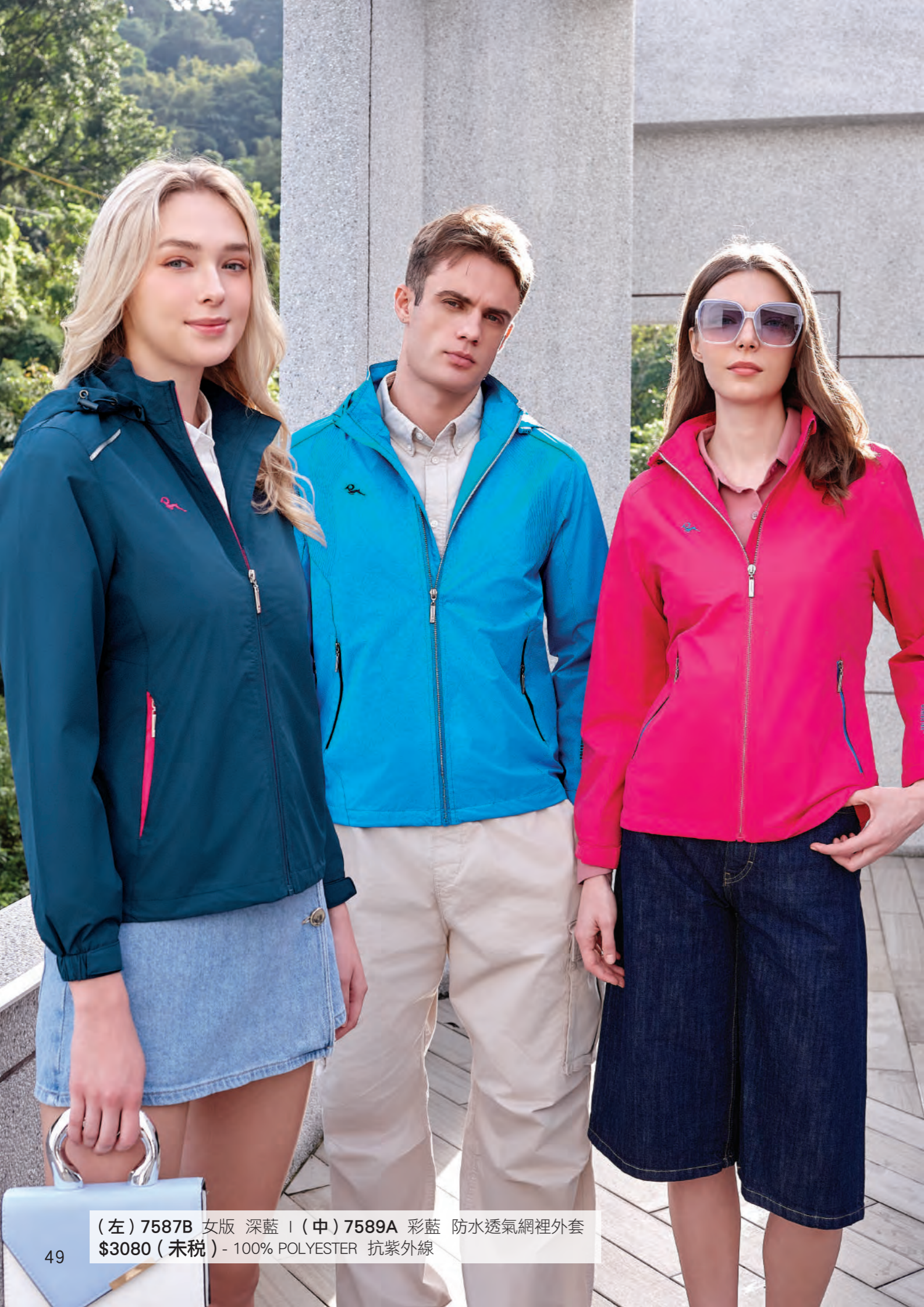
(左) 7587B 女版 深藍 | (中) 7589A 彩藍 防水透氣網裡外套 $3080 (未稅) - 100% POLYESTER 抗紫外線