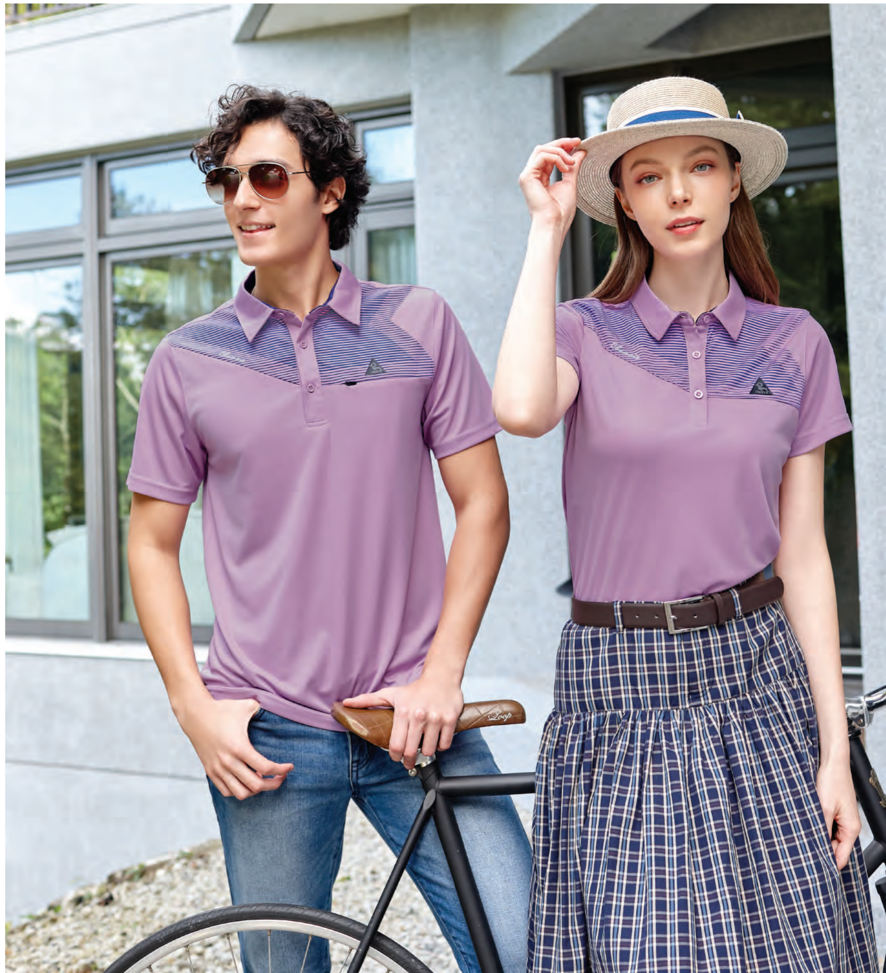
(左) 2807A | (右) 2807B 女版 粉紫 $1980 (未稅) - 100% POLYESTER 抗紫外線 吸濕排汗布