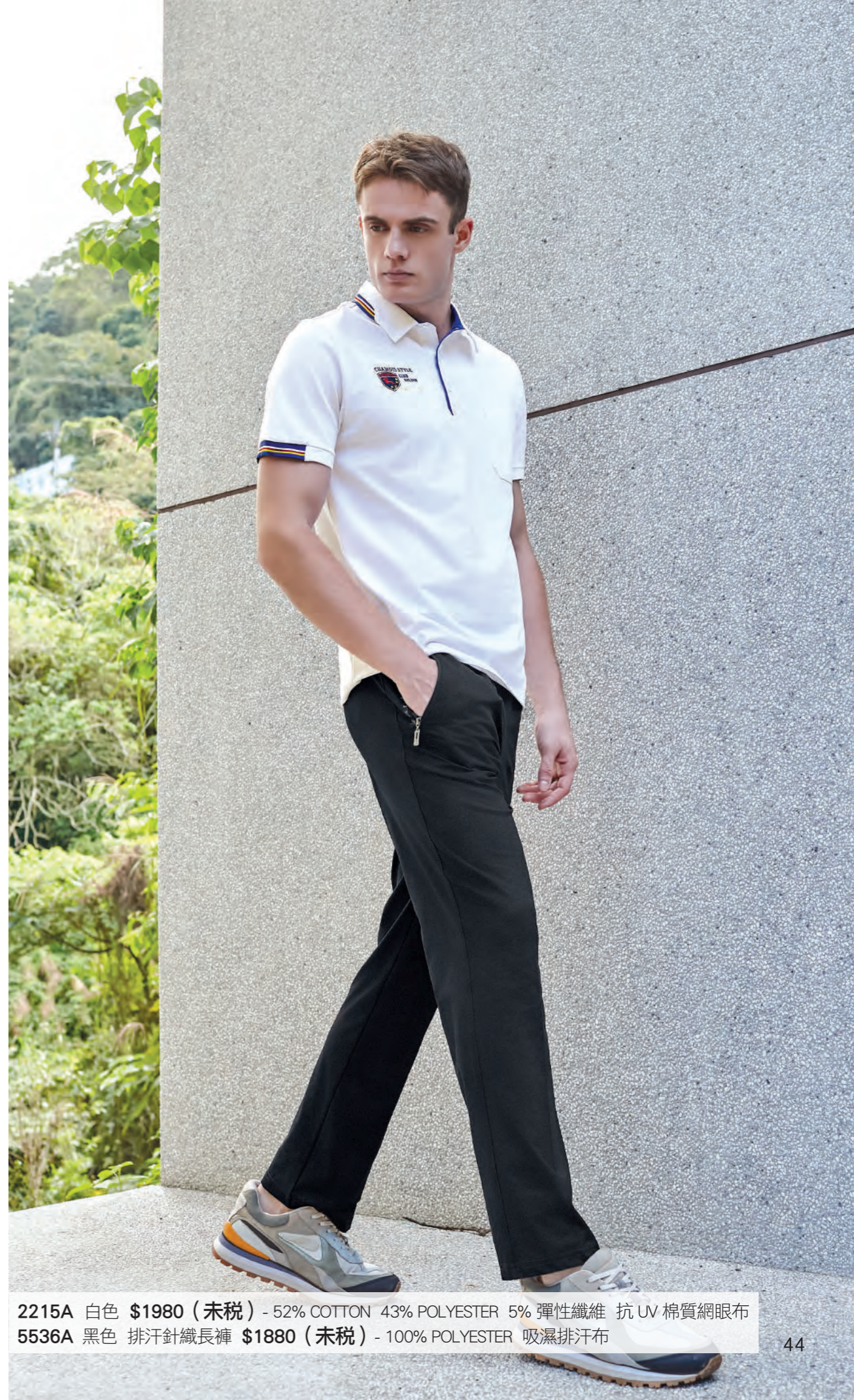
2215A 白色 $1980 (未稅) - 52% COTTON 43% POLYESTER 5% 彈性纖維 抗UV 棉質網眼布 5536A 黑色 排汗針織長褲 $1880 (未稅) - 100% POLYESTER 吸濕排汗布