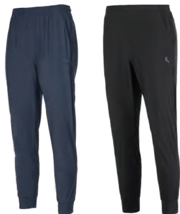
5533B 深藍 | 5533C 黑色 冰涼束口長褲 $2080 (未稅) 73% NYLON 27% 彈性纖維 ▶ 形象頁請見 P24