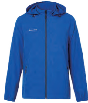
9515A 寶藍 彈性外套 $2780 (未稅) 93% POLYESTER 7% 彈性纖維 抗紫外線 附收納袋