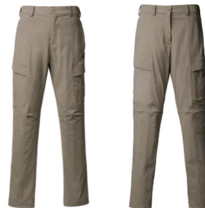
6612A | 6612B 女版 卡其 吸濕速乾彈力登山褲 $3780 (未稅) 97% NYLON 3% 彈性纖維 ▶ 形象頁請見 P12.22.40.67 / P22.60