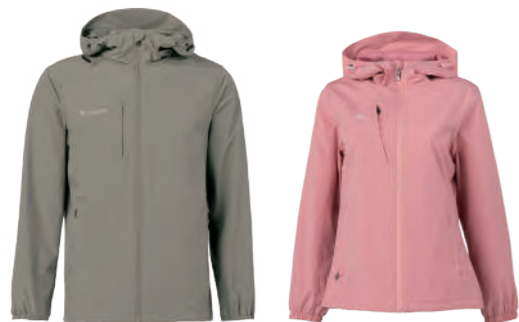
7590A 綠卡其 | 7590B 女版 柔粉色 防水透氣輕薄風衣 $2880 (未稅) 100% POLYESTER 抗紫外線 附收納袋 ▶ 形象頁請見 P53