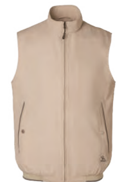
J783 卡其色 單面鋪薄棉背心 $2380 (未稅) 100% POLYESTER