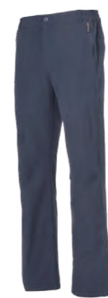
6610 深藍 彈力登山褲 $3580 (未稅) 90% NYLON 10% 彈性纖維 ▶ 形象頁請見 P29 / P56