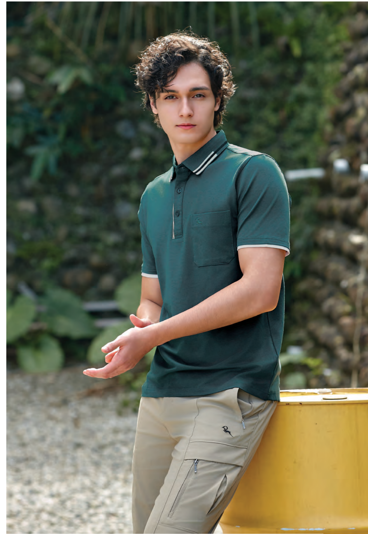
2708A 墨綠 $2080 (未稅) - 52% COTTON 43% POLYESTER 5% 彈性纖維 抗紫外線 6612A 卡其 吸濕速乾彈力登山褲 $3780 (未稅) - 97% NYLON 3% 彈性纖維