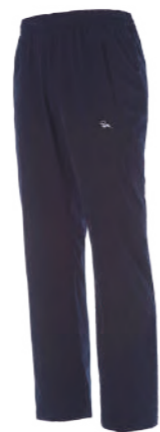
953 深藍 彈力運動長褲 $1880 (未稅) 93% POLYESTER 7% 彈性纖維