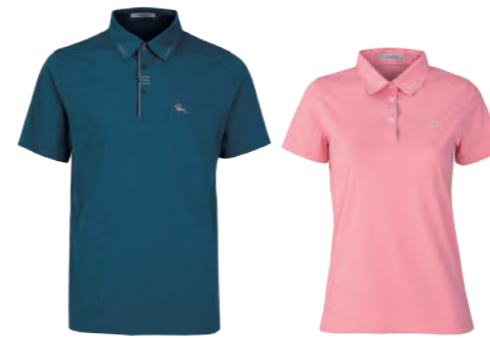
2810A -1 海藍 | 2810B -1 女版 粉色 $2080 (未稅) 88% NYLON 12% 彈性纖維 涼感 抗紫外線 吸濕排汗布 ▶ 形象頁請見 P21