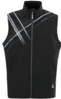
J721 黑色 單層薄背心 $2080 (未稅) 100% POLYESTER ▶ 形象頁請見 P57