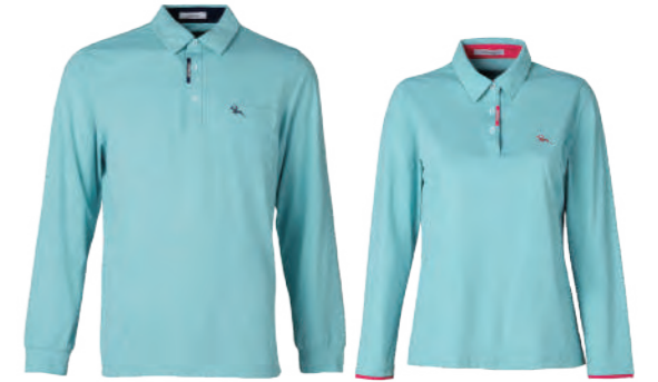
2662A | 2662B 女版 水綠 $2380 (未稅) 100% POLYESTER 抗紫外線 吸濕排汗布