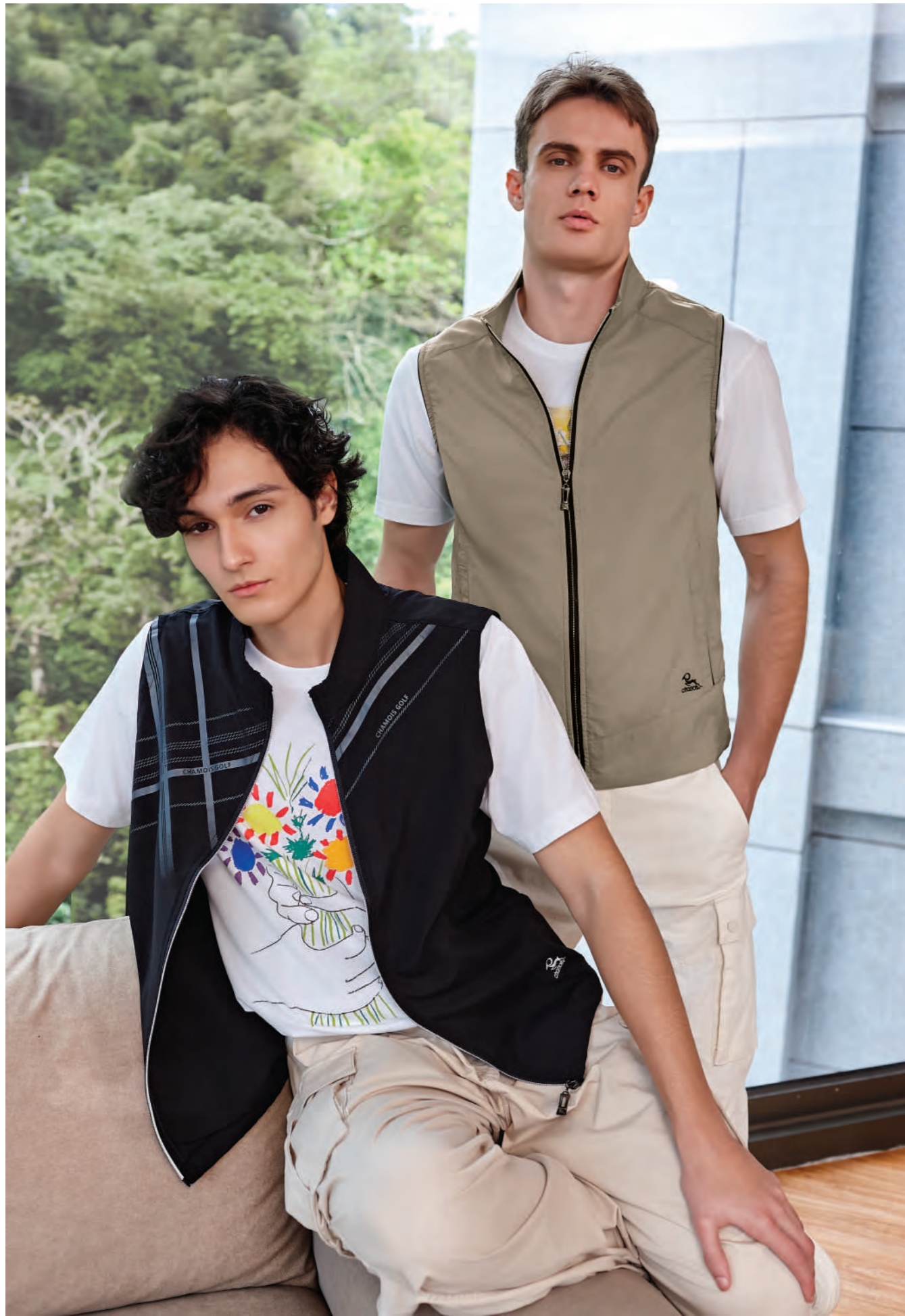
(左) J721 黑色 | (右) J720 綠卡其 單層薄背心 $2080 (未稅) - 100% POLYESTER