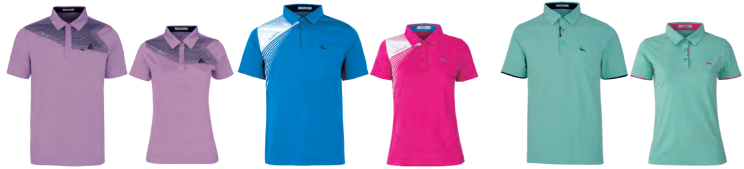
2807A | 2807B 女版 粉紫 $1980 (未稅) 100% POLYESTER 抗紫外線 吸濕排汗布 ▶ 形象頁請見 P34