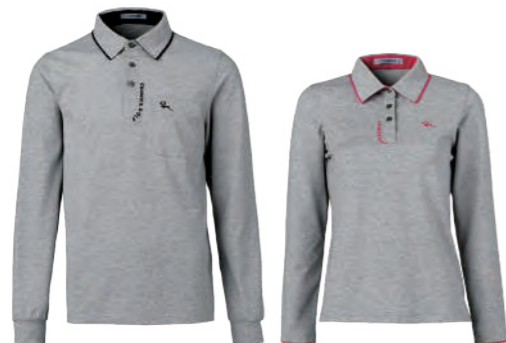
2761A | 2761B 女版 麻灰 $2380 (未稅) 52% COTTON 43% POLYESTER 5% 彈性纖維 抗 UV / 吸濕排汗 棉質網眼布