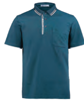
2708A 墨綠 $2080 (未稅) 52% COTTON 43% POLYESTER 5% 彈性纖維 抗紫外線 ▶ 形象頁請見 P40