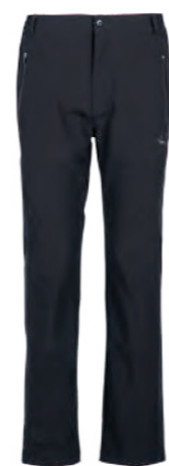
6603 黑 彈力登山褲 $3580 (未稅) 90% NYLON 10% 彈性纖維 ▶ 形象頁請見 P55