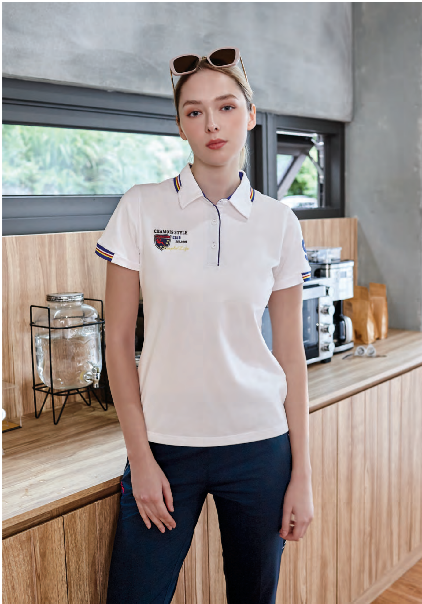
2215B 女版 白色 $1980 (未稅)

- 52% COTTON 43% POLYESTER 5% 彈性纖維 抗UV 棉質網眼布