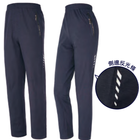
5537A | 5537B 女版 深藍 排汗針織長褲 $1880 (未稅) 100% POLYESTER 吸濕排汗布 ▶ 形象頁請見 P26