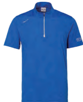
2311A 寶藍 $2380 (未稅) 92% POLYESTER 8% 彈性纖維 抗紫外線 吸濕排汗布