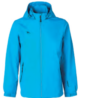
7589A 彩藍 防水透氣網裡外套 $3080 (未稅) 100% POLYESTER 抗紫外線 ▶ 形象頁請見 P49