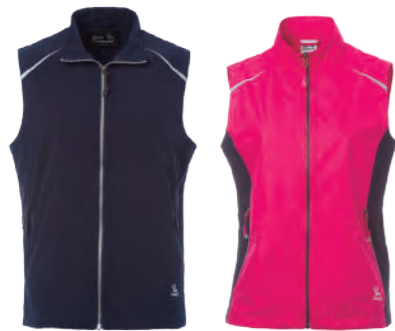
J710A 深藍 | J710B 女版 桃紅 彈性背心 $2080 (未稅) 93% POLYESTER 7% 彈性纖維 ▶ 形象頁請見 P65