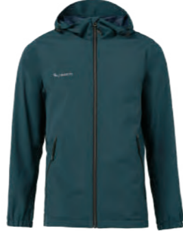
7591 松綠色 防水透氣輕薄風衣 $2880 (未稅) 100% POLYESTER 抗紫外線 附收納袋 ▶ 形象頁請見 P54