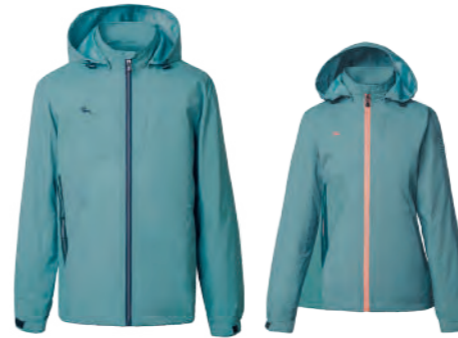
7592A | 7592B 女版 豆綠色 防水透氣網裡外套 $3080 (未稅) 100% POLYESTER 抗紫外線 ▶ 形象頁請見 P51