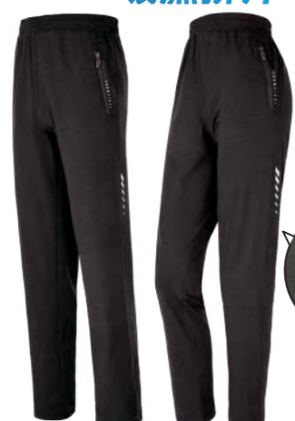
5536A | 5536B 女版 黑色 排汗針織長褲 $1880 (未稅) 100% POLYESTER 吸濕排汗布 ▶ 形象頁請見 P44