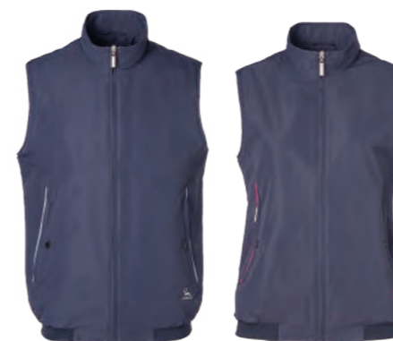
J782A | J782B 女版 深藍 單面鋪薄棉背心 $2380 (未稅) 100% POLYESTER