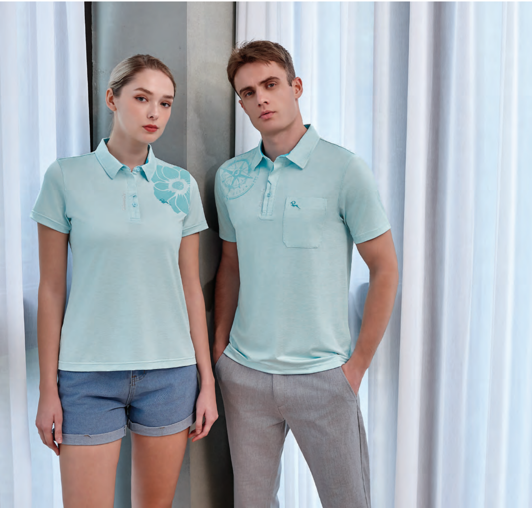
(左) 2702B 女版 | (右) 2702A 水色 $2080 (未稅) - 92% POLYESTER 8% 彈性纖維 抗紫外線 吸濕排汗布