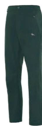
6608 深灰綠 彈力登山褲 $3780 (未稅) 93% POLYESTER 7% 彈性纖維 ▶ 形象頁請見 P48