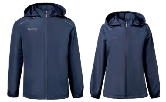
7587A | 7587B 女版 深藍 防水透氣網裡外套 $3080 (未稅) 100% POLYESTER 抗紫外線 ▶ 形象頁請見 P50 / P49