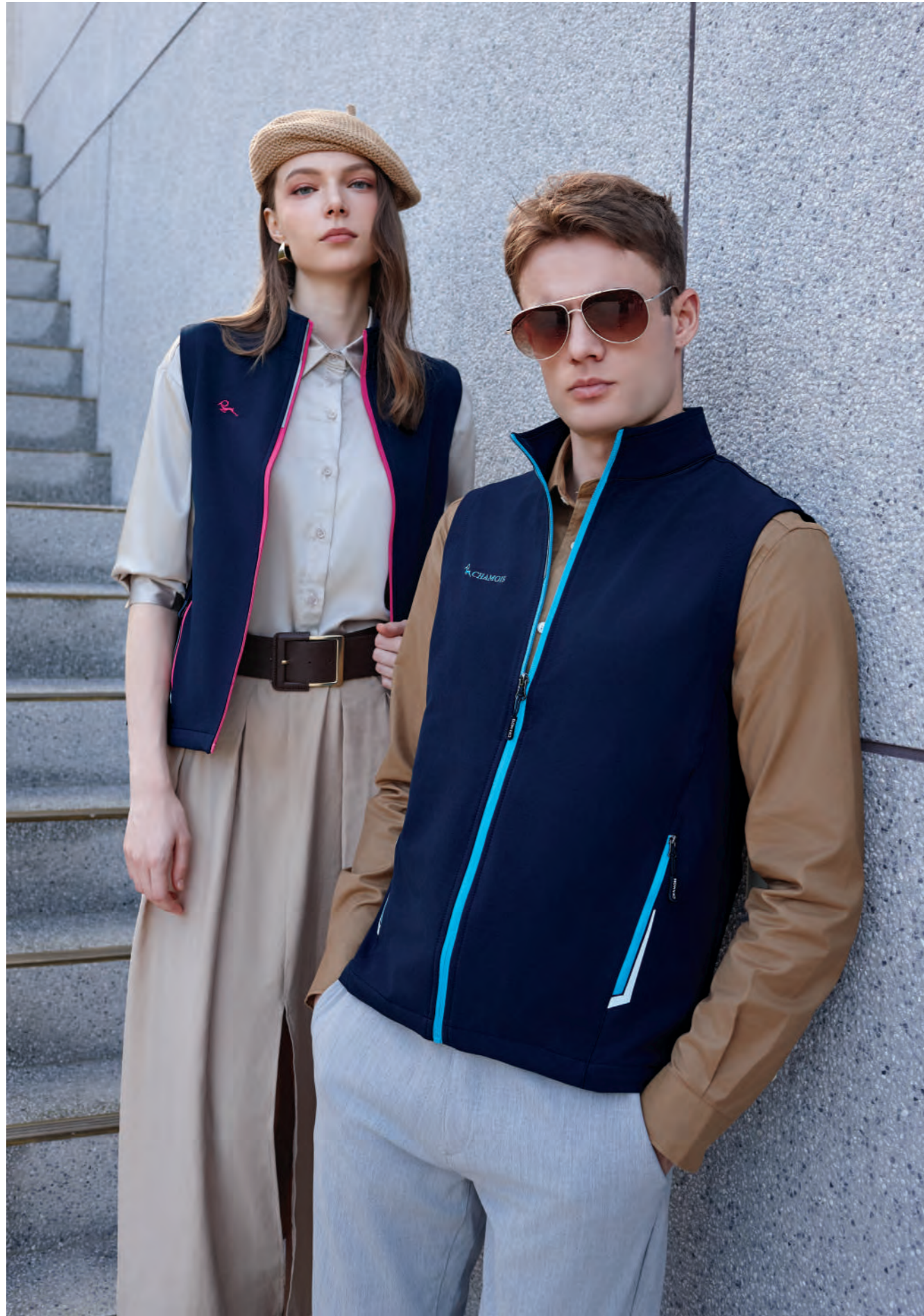
(左) J713B 女版 | (右) J713A 深藍 彈性背心 $2380 (未稅) - 93% POLYESTER 7% 彈性纖維