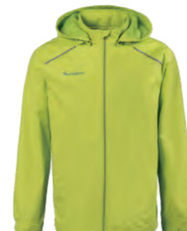
7588A 果綠 防水透氣網裡外套 $3080 (未稅) 100% POLYESTER 抗紫外線 ▶ 形象頁請見 P50